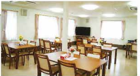
BGMが流れる、ゆったりとした食堂・コミュニティスペース。 各種イベントも開催いたします。