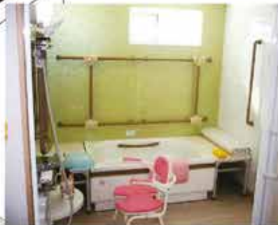
プライバシー重視で楽しく入浴していただけます。