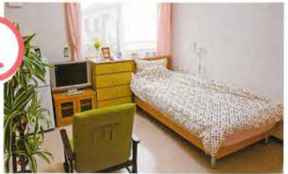
部屋は明るく、エアコンが付いて快適。 また、窓からの景観も素晴らしいです。