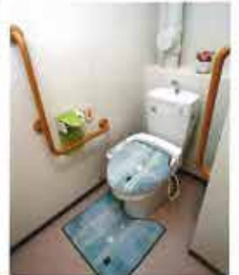
トイレは、車イスでも 安心して利用OK