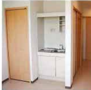
全室クローゼットとミニキッチン完備